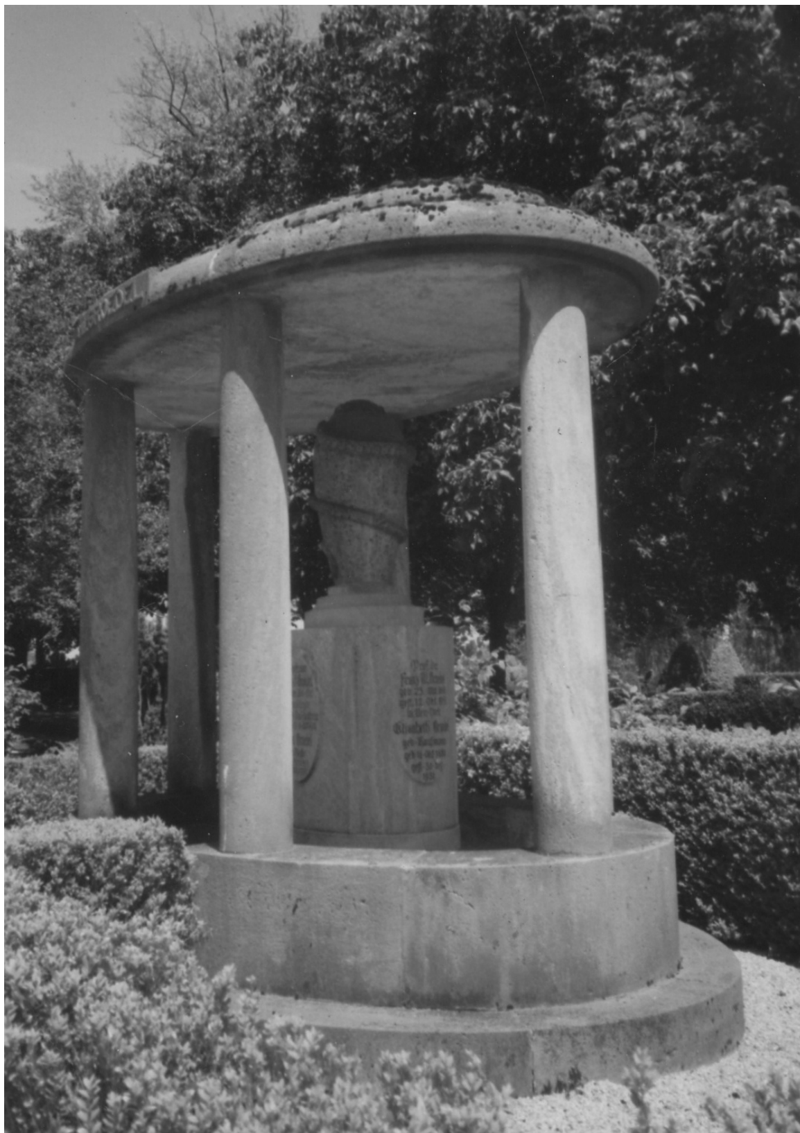
Abb. 9: Familiengrab Groedel in Bad Nauheim, 2015