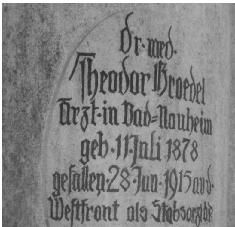
Abb. 8: Detail: Inschrift Familiengrab Groedel, 2015