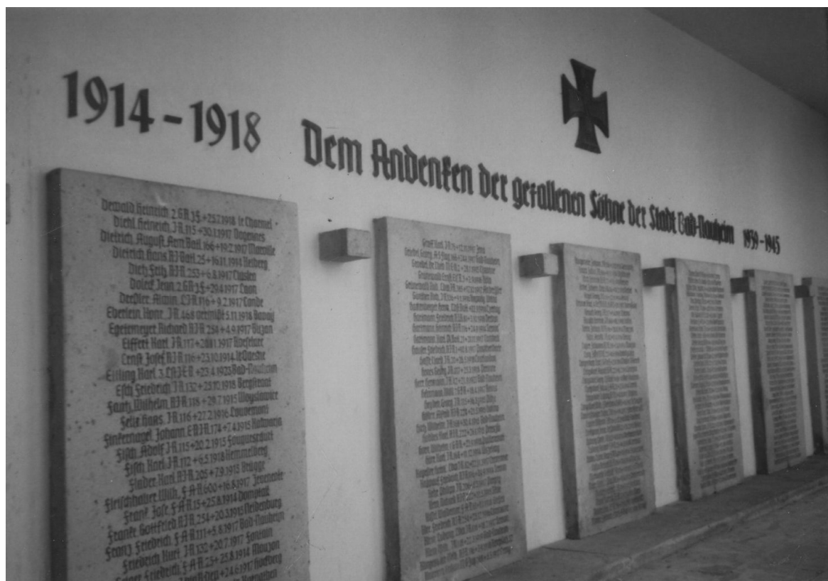
Abb. 1-2: Frontal- und Detailansicht des Bad Nauheimer Kriegsmahnmals, 2015